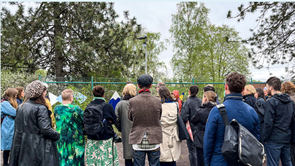
Inspiration och nätverk. I maj deltog Urban Futures i två utvecklingsdagar tillsammans med nätverket DynamoVäst och Region Halland, Skåne och Kronoberg. Temat var slöjd och slöjdens betydelse inom gestaltad livsmiljö.

Flera gemensamma projektansökningar initierades mellan spårets medlemmar, vilket bland annat innebar uppstart av ett projekt om hur kulturvärden kan visualiseras i en digital tvilling. Med koppling till spåret och Urban Futures fortsatta engagemang i nätverket Dynamo Väst genomfördes också ett lokalt event inom New European Bauhaus, i samarbete med Röhsska museet och Borås Science Park. I slutet av året tillkom två nya representanter i utvecklingsgruppen från Göteborgs universitet och Västra Götalandsregionen.