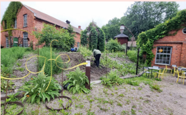
Healing Heritage. Projektet Healing Heritage - Att kurera förorenade landskap och landsbygds offentliga rum avslutades med en utställning (till höger). Projektet har bland annat anlagt en visningsträdgård (ovan).

Projektet har också möjliggjort samskapande av en gemensam klimatomställningsstrategi med berörda förvaltningar och bolag i Göteborg. I slutet av året kom besked om en fortsatt utveckling genom projektet Klimatneutrala Göteborg och Falköping 2030 3.0 .