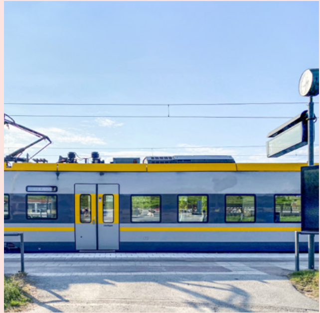
Urbana stationssamhällen . Floda är ett av tre stationsnära områden som ingått i projektet som avslutades under året. Ta del av resultatet från projektet på urbanfutures.se .

Att gemensamt identifiera och utveckla projektidéer och att söka projektfinansiering ingår i arbetet med Urban Futures tematiska spår. Kansliet bidrar bland annat med löpande bevakning av relevanta utlysningar och kan stötta parterna i processen med att utveckla en projektidé i samskapande mellan forskning och praktik. Under 2024 har flera projekt avslutats. Att söka externa projektmedel för att stärka kansliet och verksamheten på längre sikt har därför varit en del av verksamheten under året. Under 2024 har Urban Futures ingått i eller stöttat åtta ansökningar. Av dessa blev fyra beviljade.