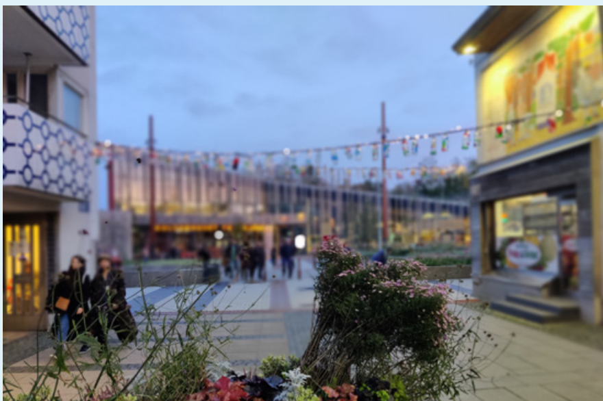
Kulturhuset i Bergsjön.

Fokus har också varit på att sammanställa och vidareutveckla slutsatserna från samtliga workshops som hållits inom spåret om utvecklingen av funktioner som stöttar transdisciplinära samarbeten och forskning. Målet är att, baserat på slutsatserna och aktuell forskning inom området, föreslå en kategorisering av funktioner och stödmekanismer som bedöms ha relevans på lokal nivå, i anslutning till Urban Futures och Wexus verksamhet. Under året skickades en forskningsansökan in med koppling till spåret, som dock inte blev beviljad. I anslutning till spåret publicerades även Sustainable Cities i Elgar Encyclopedia of Interdisciplinarity and Transdisciplinarity.